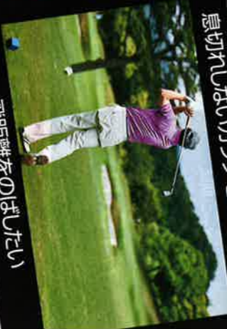
飛距離を伸ばしたい

夫でも大丈夫 飽きやすいあなたでも大丈夫 飽きない秘密がここにある! 詳細は裏面へ