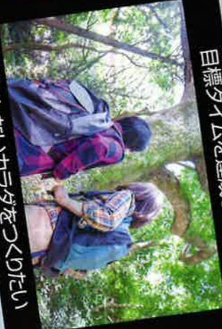
息切れないカラダをつくりたい