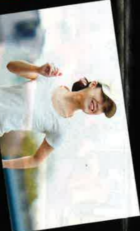
目標タイムを達成したい